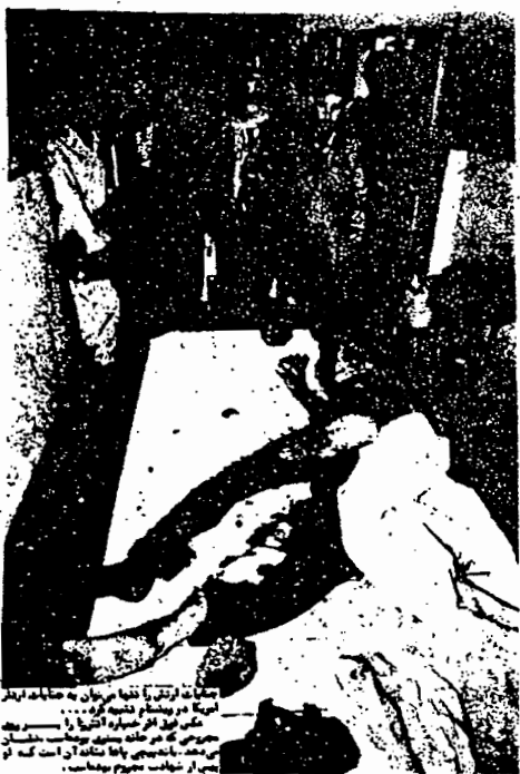
مبارزانی که در راه آزادی میهن ما کشته شدند

سازمان ما، شاخه کردستان متعاقب اعلام آتش بس از طرف هیئت نمایندگی خلق کرد اطلاعیه ای مبنی بر رعایت آتش بس در تاریخ ۱۰ اردیبهشت ۵۹ صادر کرد که جهت آگاهی بیشتر هم میهنان از ماهیت سرکوبگر ارتش عین اطلاعیه سازمان شاخه کردستان و اطلاعیه حزب دمکرات کردستان و اطلاعیه ارتش و سپاه پاسداران را ذیلاً می آوریم: