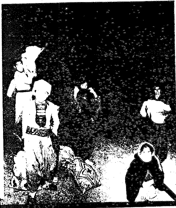
ارتشی که پیش از قیام دهها هزار تن از مردم میهن ما را گشتار کرد، امروز نیز زحمتکشان کردستان را از زمین و هوا زیر آتش گرفته است. عکس بالا یک خانواده زحمتکش کرد را نشان می دهد که در زیر بمباران فانتومها، شبانه کوچ می کنند.

همگامی با نهضت مقاومت خلق کرد وظیفه مبرم همه نیروهای مبارز و انقلابی ایران است